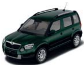
Amazonian Green металл