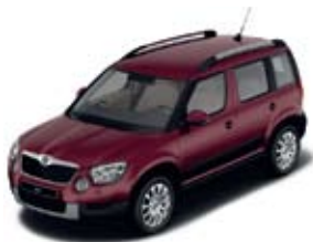
Rosso Brunello металл