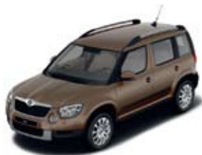
Mato Brown металл