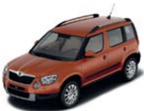
Tangerine Orange металл