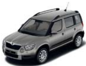
Cappuccino Beige металл