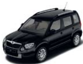
Black Magic перламутровый