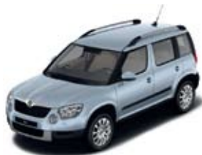
Aqua Blue металл