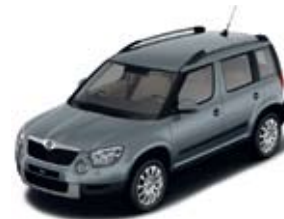
Platin Grey металл