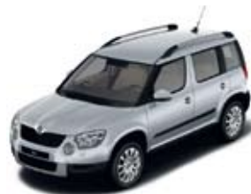
Brilliant Silver металл