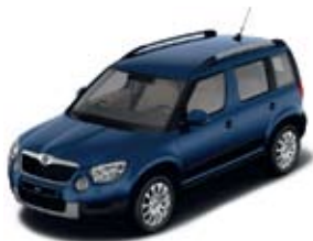
Storm Blue металл